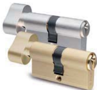
Cylindres à bouton

Pour les 1/2 cyl à bouton (jusqu'au 10/60) : ajouterxxxx € brut (voir page 16). Possibilité pêne indexable sur autres dimensions (voir page16)